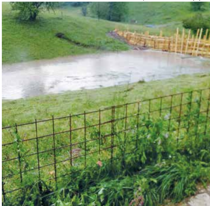
Обилне падавине поплавиле имања

подручју бјелополске општине. – Истина, има одлазака, али не као у неким другим срединама, јер је захваљујући подстицајима за пољопривреду и сточарство преко разних пројеката у наше подручје уложено око милион еура. То је задржало и доста младих људи, који су на тај начин засновали породице и везали судбину за овај крај – нагласио је Дуровић, додајући да очекује да таква врста помоћи буде настављена и у наредном периоду.