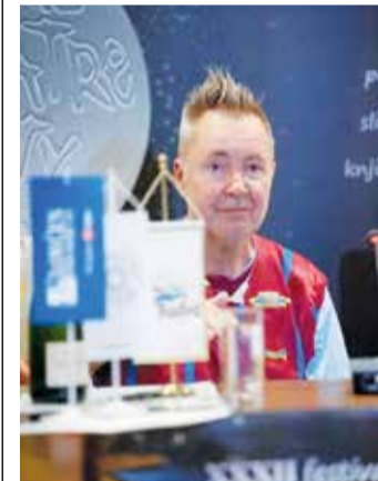
Израдио жељу да се сусретне са црногорским музичарима

– Мислим да је одлика великих људи да буду реални и стабилни. Ако вам је музика