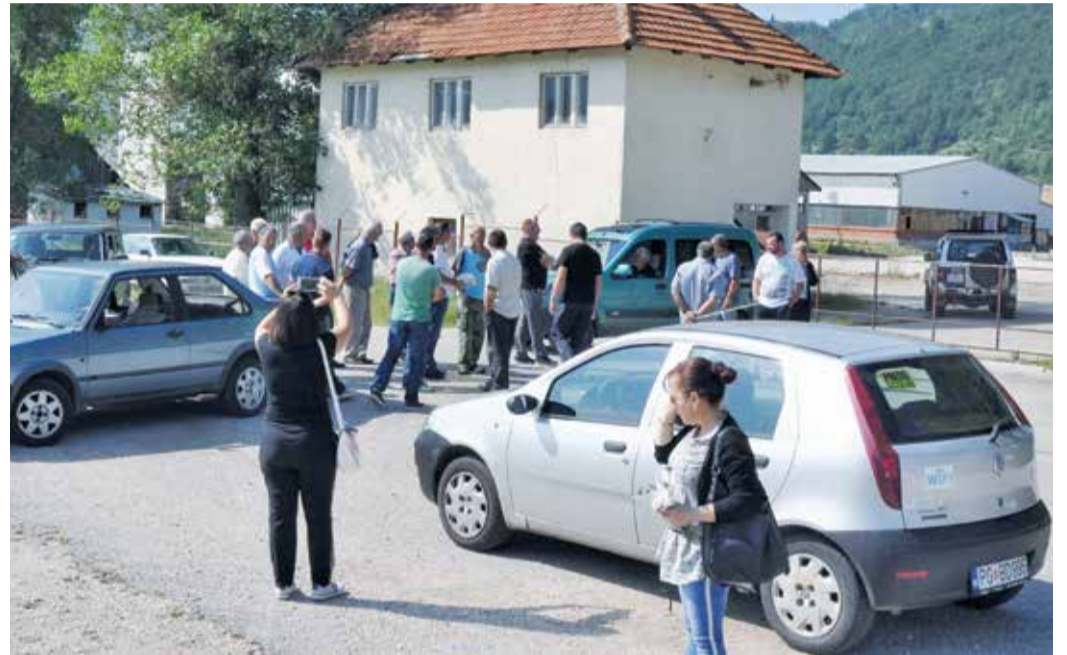
Наставља се блокада пута у Брезнима

– Тек када смо блокирали извођење радова, они су нас саслушали и тражили елаборат, иако је њихова законска обавеза била да путну инфраструктуру коју су уништили радовима врате у првобитно стање. Тај пут, који су градили мјештани Брезана самодоприносом и на својој имовини, није био предвиђен за пролазак на хиљаде тона тешких терета и механизације, а сада је наша егзистенција угрожена