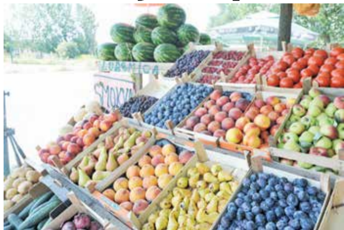
Тезге препуне воћа и поврћа

У понуди су, како причају, само домаћи производи. Кило-