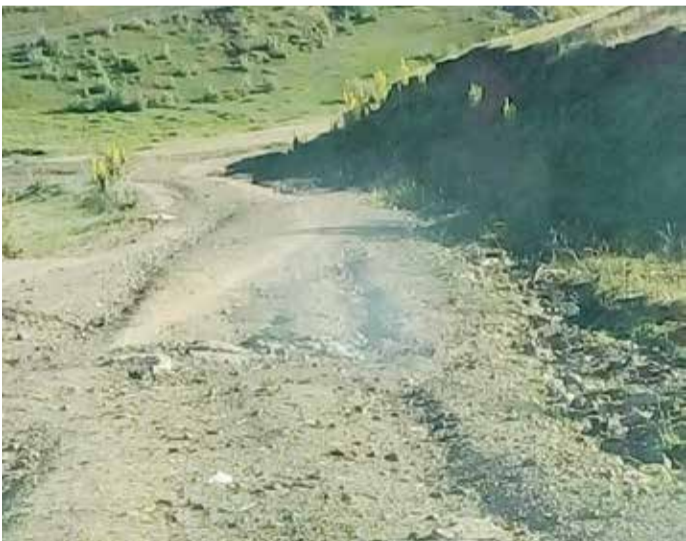
Локални пут у катастрофалном стању

Према ријечима мјештана, већ годинама немају квалитетно снабдијевање електричном енергијом, водом, а путеви су у лошијем стању него што су били прије Другог свјетског рата.