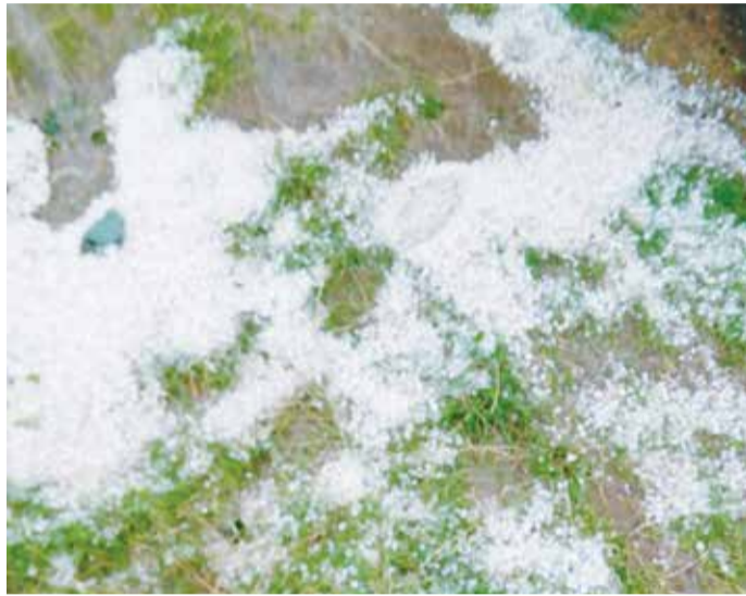
Град десетковао усјеве

Према његовим ријечима, миграција у Коритима није толико изражена као што је то случај с другим мјесним заједницама на