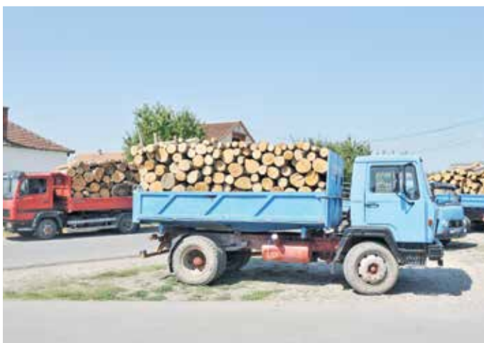
Букова допремљена из Колашина