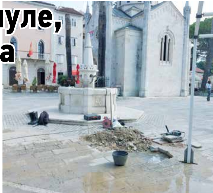
Цијев дотрајала, вандале неуморни

– Цијев пуца пошто је стара и дотрајала. Приде је притисак