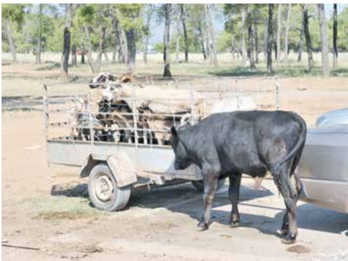
Продавци задовољни продајом

Ванпијачни продавци телад на Сточној пијаци јуче су задовољно трљали руке. По килограму живе ваге телад су се могла купити од 3,20 до 3,30 еура односно од 350 до 550 еура по грлу. Краве су 350 до 600 еура по грлу или 1,10 еура по килограму живе ваге, бикови су цијењени 2,20 еура по килограму живе ваге, односно од 950 до хиљаду еура по грлу.