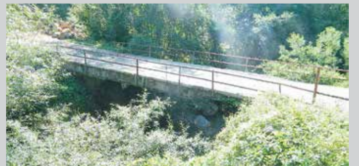
Мост у Кошутини