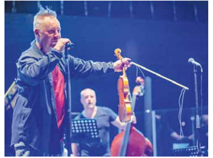
Кенеди на концерту у Будви

ВИРТУОЗ НАЈЏЕЛ КЕНЕДИ ПРИРЕДИО СПЕКТАКЛ НА ГРАДУ ТЕАТРУ