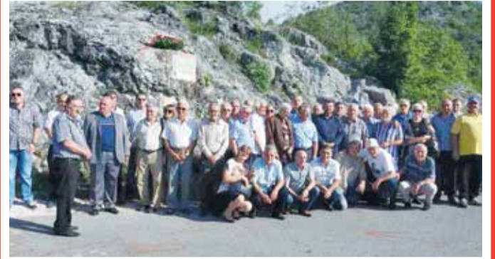
Полагање вијенца на Кошћелама

ОРГАНИЗАЦИЈА БОРАЦА НОР-а ПОЛОЖИЛА ВИЈЕНЦЕ НА СПОМЕНИК НА КОШЋЕЛАМА