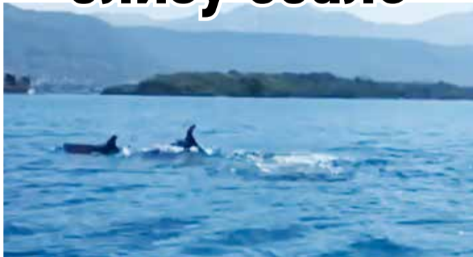
Делфини у Кртолима

ТИВАТ – Мјештани Кртола и госте обрадовало је минулог викенда јато делфина који су се безбрижно и без икаквог страха играли поред обале Турашевића и популарне пливине „Туња“ код острва Страдиоти. Према свједочењу рибара, у Боки је последњих година стално присутно мање јато делфина које с времена на вријеме оживи успомене на легендарног делфина Јоцу, који је био права атракција осамдесетих година. Због чињенице да