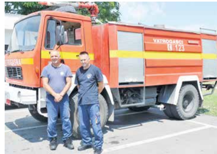
Поповићи на радном мјесту